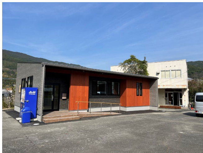
七山支所 新事務所

この「七山支所 新事務所」落成を機に、これまで以上に組合員の皆様の声を大切にしながら、更なる組合員サービス等の充実を目指して参ります。